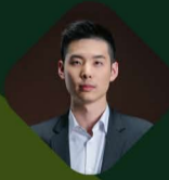
关心 联合创始人 & 风险管理委员